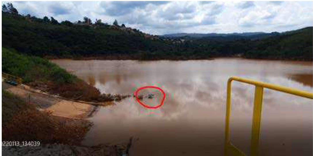
Figura 4 - Foto do dia 13 de janeiro de 2022 demonstrando a bomba hidráulica instalada de forma emergencial para auxiliar no esvaziamento da ECJ.