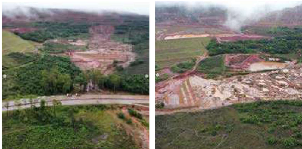
Figura 1 - Imagens do local do rompimento da pilha de co-disposição de estéril e rejeito da Mineração Vallourec S.A. ocorrido em 08 de janeiro de 2022.

A pilha de co-disposição de rejeito/estéril da empresa Vallourec que rompeu em Nova Lima passou recentemente por um processo de licenciamento ambiental para ampliação da estrutura. No dia 27 de julho de 2017, o empreendedor formalizou o Processo Administrativo nº00012/1988/032/2017 para Licenciamento Ambiental Concomitante em uma única fase, englobando no mesmo processo as licenças Prévia, de Instalação e de Operação para a ampliação da pilha de co-disposição de rejeito e estéril. Em 09 de dezembro de 2020 foi emitido pela Superintendência Regional de Meio Ambiente Central Metropolitana da SEMAD o Parecer Único nº 153/2020 6 recomendando a concessão das licenças, as quais foram emitidas em 21 de janeiro de 2021.