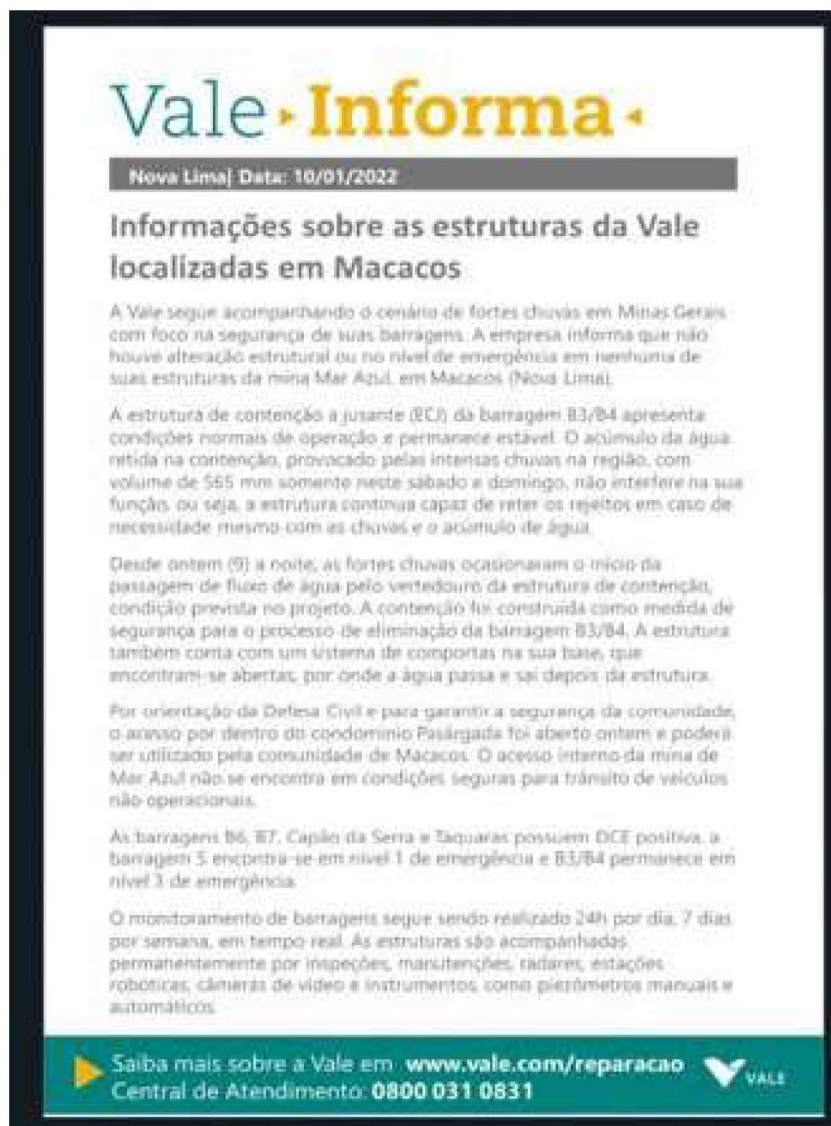
Figura 2 - Comunicado "Vale Informa" do dia 10 de janeiro de 2022

Somente no dia 14 de janeiro de 2022, em novo comunicado "Vale Informa" emitido às 15h apresentado a seguir, a empresa começa a admitir a possibilidade de eventuais falhas no projeto ou na execução da ECJ, sempre culpando os elevados volumes de chuva, quando informa que: